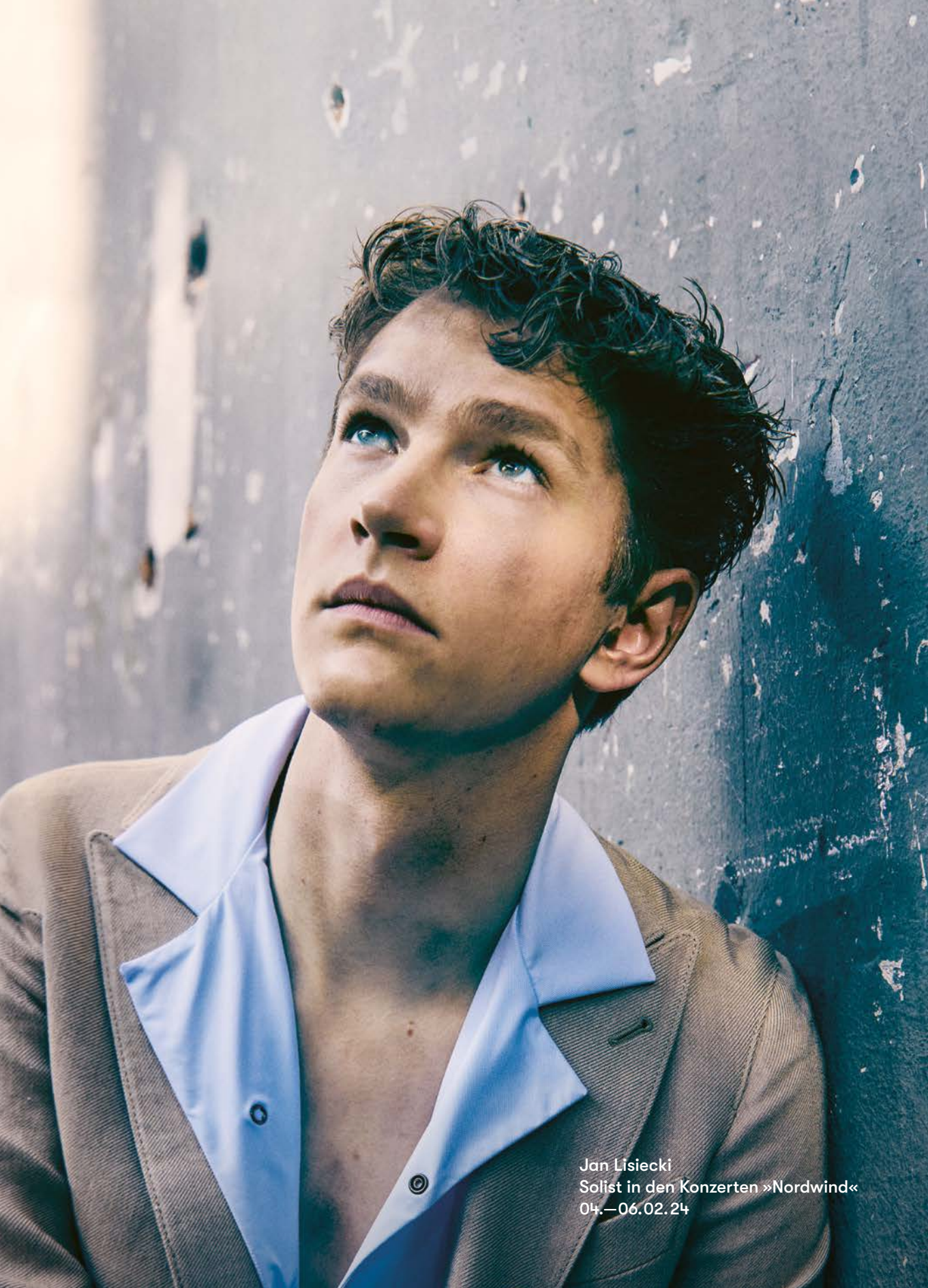
Jan Lisiecki Solist in den Konzerten »Nordwind« 04.—06.02.24