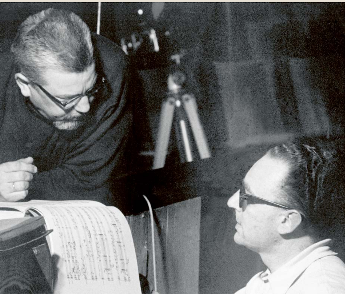
Der Komponist der Oper Die Soldaten , Bernd Alois Zimmermann (l.), unterhält sich mit dem Dirigenten und musikalischen Leiter Michael Gielen während einer Probe im Kölner Opernhaus am 12. Februar 1965.