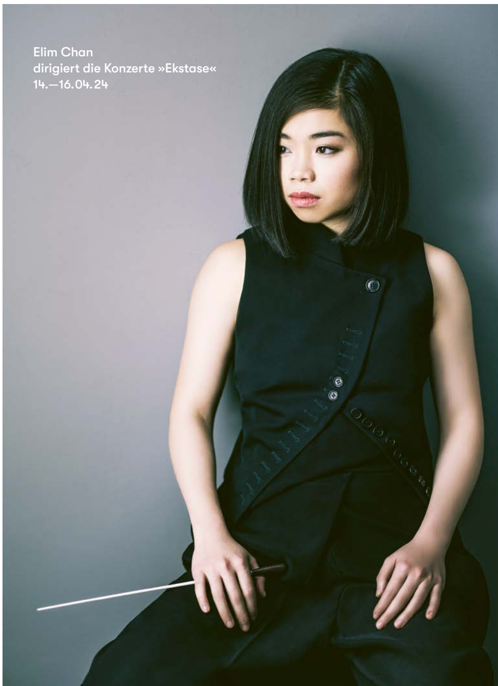
Elim Chan dirigiert die Konzerte »Ekstase« 14.–16.04.24