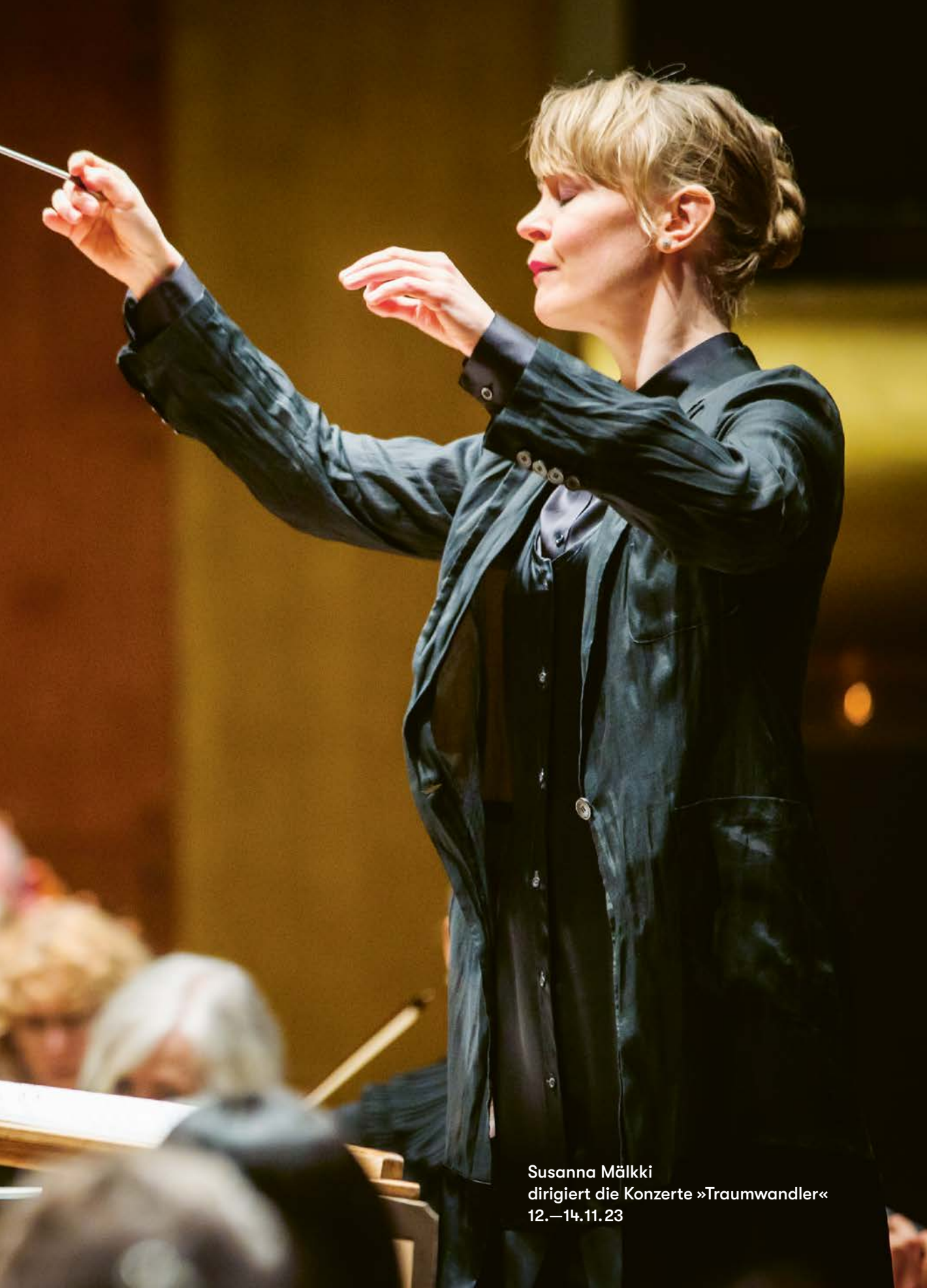
Susanna Mälkki dirigiert die Konzerte »Traumwandler« 12.—14.11.23